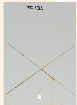
Zinc/Époxy/Uréthane Système à 3 couches 9 mils (225 microns)

Le panneau métallique a été correctement préparé et enduit d'apprêt au zinc et d'une finition uréthane de Devthane® 349QC. Le panneau enduit a été X-cut à travers le film et placé dans une chambre humide pendant 2000 heures. Comme noté, la corrosion du revêtement était minimale à la coupe du film.