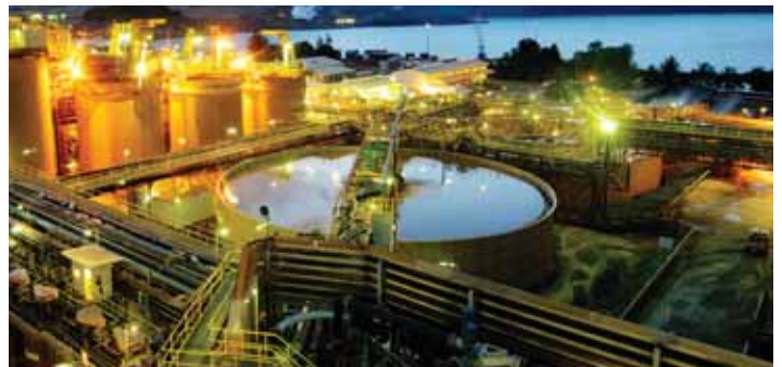
Lihir Gold Mine, Papua New Guinea, 2007: Allsidigheten gjorde at Interzone® 954 ble et av nøkkelproduktene i dette store prosjektet.