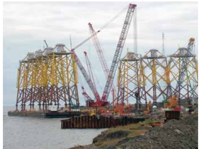
O Interzone® 1000 é amplamente utilizado no setor de energia eólica offshore