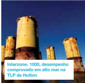
Interzone® 1000, desempenho comprovado em alto mar na TLP de Hutton