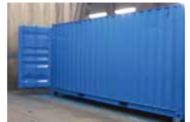
Interthane 990 afwerklaag voltooid op dag 2