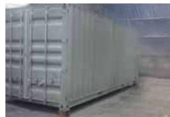
Snelhardend Interzinc 22 en bindlaag/ tussenlaag op dag 1

Op een stalen scheepscontainer werd Interzinc 22 aangebracht bij 19°C (66°F) en 58% relatieve vochtigheid. Snelhardend Interzinc 22 kon in minder dan vijf uur worden overschilderd, zodat op dezelfde dag een afdichtlaag en een tussenlaag van Intergard 475HS konden worden aangebracht. Dat betekent dat de afwerklaag, Interthane 990, de volgende dag kon worden aangebracht, 24 uur eerder dan wanneer een conventioneel, langzaam drogend anorganisch zinksilicaat zou zijn gebruikt.